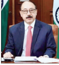
हर्ष वी श्रृंगला

भारत की अध्यक्षता में सफल हुए जी20 शिखर सम्मेलन के जरिए भारत की क्षमता को पूरी दुनिया ने देखा। साथ ही अंतर्राष्ट्रीय सहयोग और कूटनीति को बढ़ावा देने के लिए देश की प्रतिबद्धता पर जोर दिया गया। भारत की जी20 अध्यक्षता ने समावेशी और सहयोगात्मक